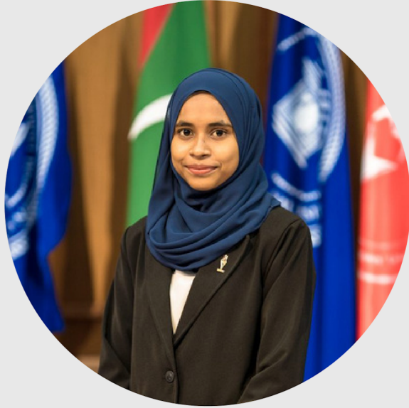
پروفیسر ڈاکٹر (ایس۔ پی۔ ایچ) سیدہ

پروفیسر ڈاکٹر سیدہ (ایس۔ پی۔ ایچ) نے اپنے کیریئر کے دوران متعدد بین الاقوامی اور مقامی اداروں میں خدمات انجام دی ہیں۔ ان کی تحقیقاتی کاموں کا تعلق مختلف شعبوں سے ہے، جس میں سماجی سائنس، تعلیم اور صحت شامل ہیں۔ ان کی خدمات کو تسلیم کرتے ہوئے، ان کو متعدد ایوارڈز اور اعزازات سے نوازا گیا ہے۔